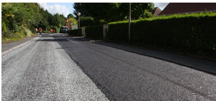
Figure 3 - Photo application MBCF sur ES