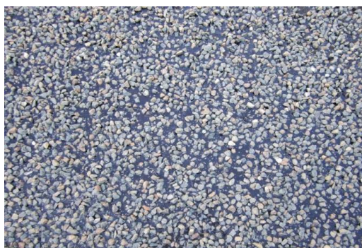
Figure 2 - Photo d'un ES à maille claire